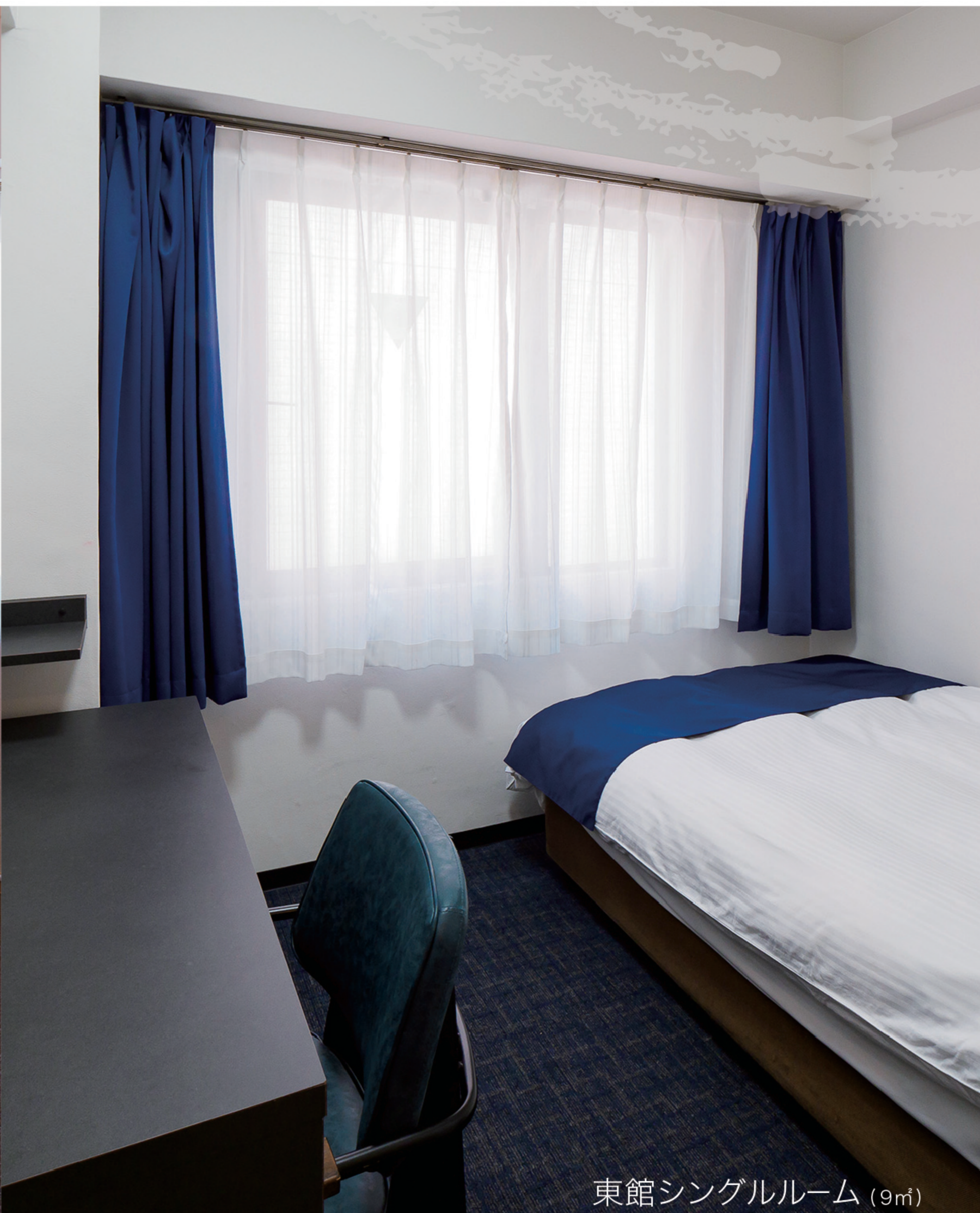
東館シングルルーム (9㎡)