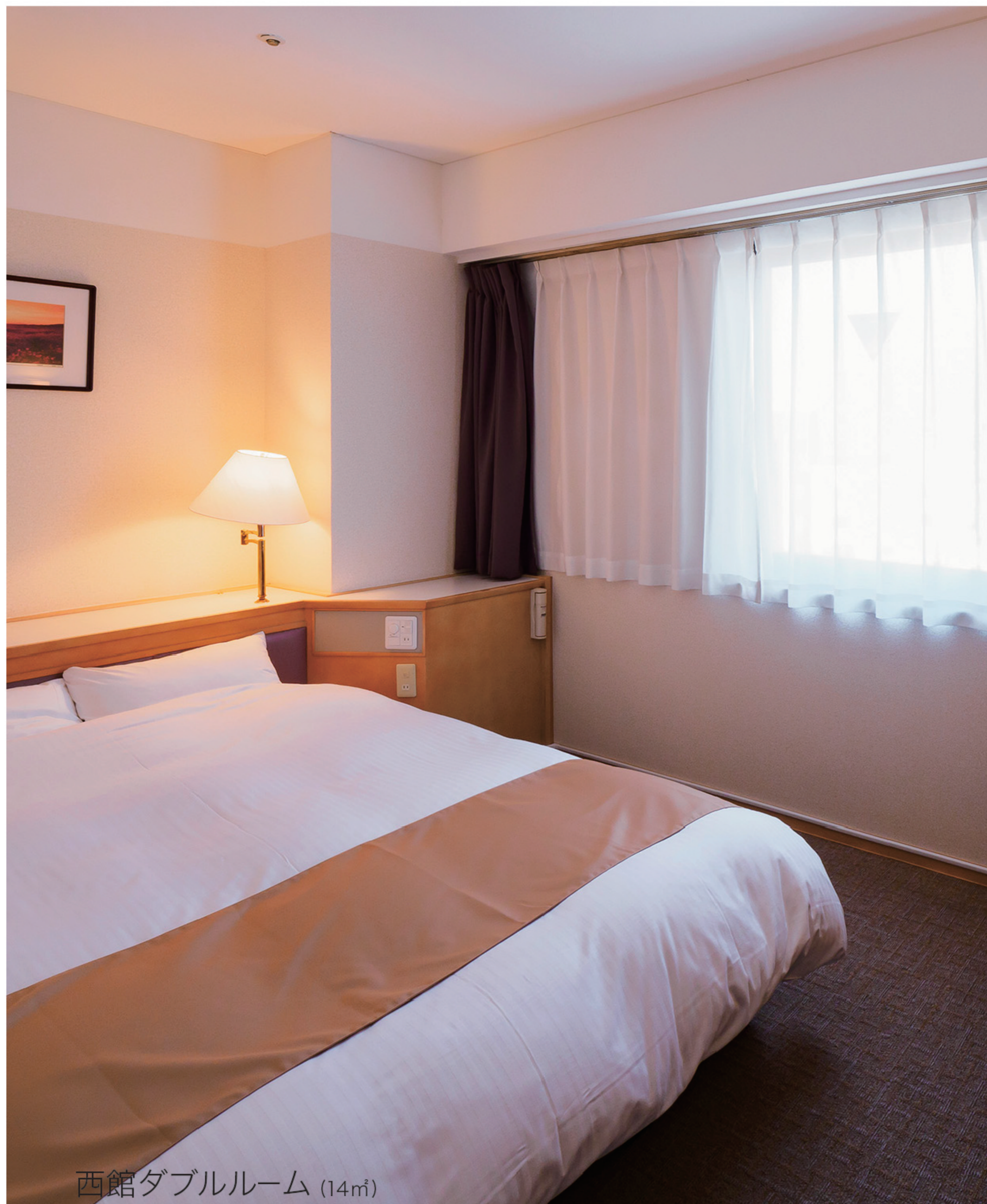
西館ダブルルーム (14㎡)